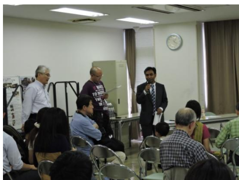
●北角顧問より挨拶