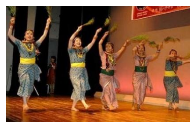
フェスティバル (2月)