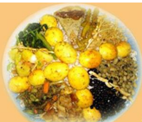
サメバジパーティ (9月)